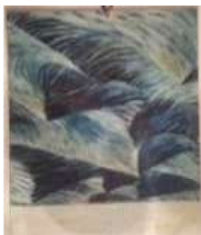
Fragmento marino. 2005. Óleo sobre lienzo. 195 x 165 cm