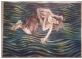
Los amantes. 2016. Óleo y carboncillo sobre lienzo. 118 x 170 cm