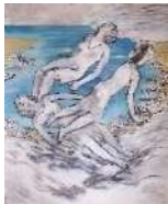
Creando mundos, nada nace solo. 2016. Óleo y carboncillo sobre lienzo. 122 x 100 cm