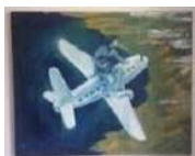
La fuga. 2016. Óleo sobre madera. 100 x 122 cm