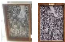
Aire sobre la ciudad financiera. 2016. Carboncillo sobre madera (díptico). 51 x 33 cm