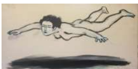
Flotando en la gravedad cero. 2016. Óleo sobre lienzo. 50 x 100 cm