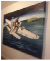
La fuga. 2016. Óleo y carboncillo sobre lienzo. 165 x 195 cm