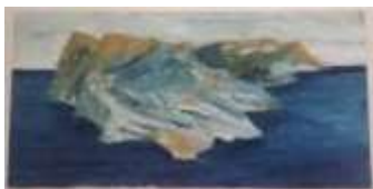
Isla I. 2016. Óleo sobre lienzo. 50 x 100 cm