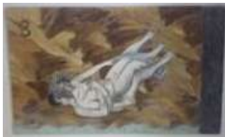
Los amantes II. 2016. Óleo y carboncillo sobre lienzo. 89 x 146 cm