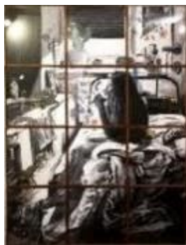
Waking life , 2019. 12 paneles, mixta (tinta, pastel, carboncillo, grafito, lápices color) sobre papel 315 gr. 100 % algodón, 200 x 150 cm. Marcos artesanales de madera color nogal, frontal de cristal