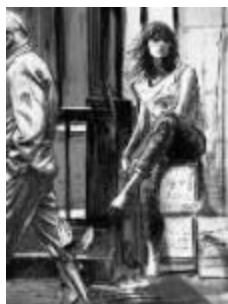
City I , 2018. Mixta (óleo, tintas conté) sobre lienzo de algodón y bastidor de madera, 100 x 70 cm. Enmarcación artesanal con bandeja de madera