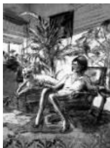
City II , 2018. Mixta (óleo, tintas conté) sobre lienzo de algodón y bastidor de madera, 100 x 70 cm. Enmarcación artesanal con bandeja de madera