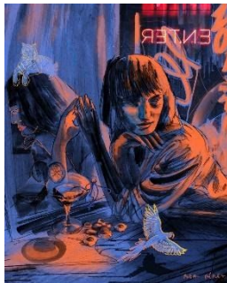
Dora Maar , 2019. Dibujo impreso en tintas pigmentadas sobre tela 100 % algodón, en caja de luz LED con marco de aluminio, 50 x 40 cm