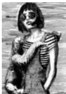
Sloth girl , 2018. Mixta (carbón, tinta, grafito) sobre papel Velin 100 % algodón 315 gr, 100 x 70 cm. Marco artesanal de madera natural y frontal de cristal