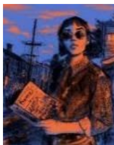
Franny & Zoey , 2018. Dibujo impreso en tintas pigmentadas sobre tela 100 % algodón, en caja de luz LED con marco de aluminio, 50 x 40 cm