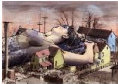
En las nubes , 2018. Mixta (tinta, lápices de colores, acuarela, grafito) sobre papel 100 % algodón, 50 x 70 cm