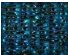
Cautivas del recuerdo , 2016. Serie «identidad». Impresión tintas pigmentadas con siliconado en metacrilato sobre soporte de aluminio, 110 x 90 cm. Serie 3/3