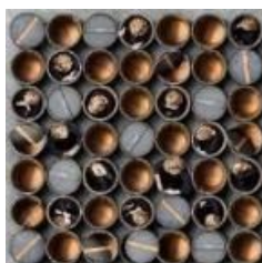
Mercancías 2.0. , 2019. Serie «globalización». Impresión directa tintas UVI sobre aluminio, 80 x 80 cm. Serie 1/3