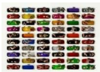
Conflicto de personalidad , 2010. Serie «inconsciente». Impresión tintas pigmentadas con siliconado en metacrilato sobre soporte de aluminio, 90 x 70 cm. U