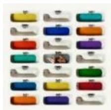
No game , 2010. Serie «inconsciente». Impresión tintas UVI sobre dibond, 80 x 80 cm. Serie 1/3